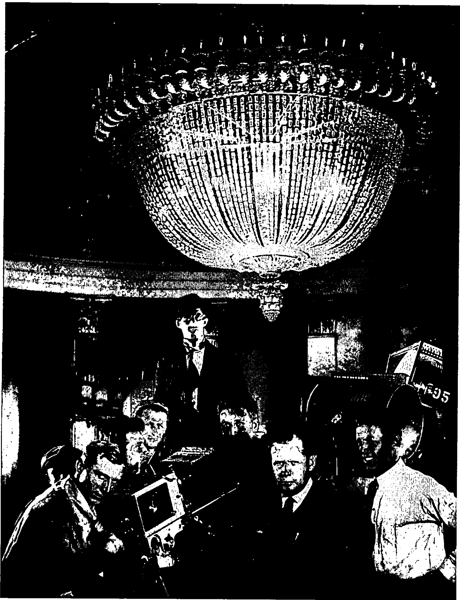
TOURNAGE DE « OCTOBRE ». AU PREMIER PLAN, DE GAUCHE A DROITE : E. TISSE, S.M. EISENSTEIN, G. ALEXANDROV.